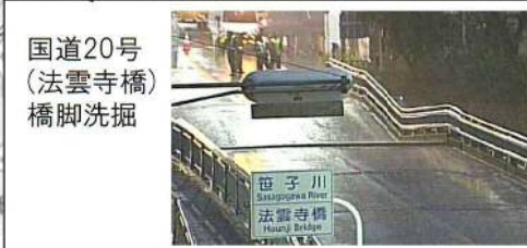
国道20号 (法雲寺橋) 橋脚洗掘