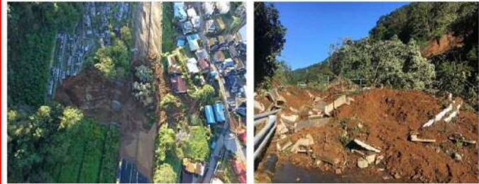
相模湖東～相模湖 規模:幅 約50×高さ 約20m(約6,000㎡)