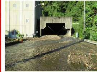
小仏トンネル東坑口付近 規模:幅 約300×高さ 約15m(約500㎡)