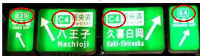
標識ナンバリング設置工事 施工前・施工後