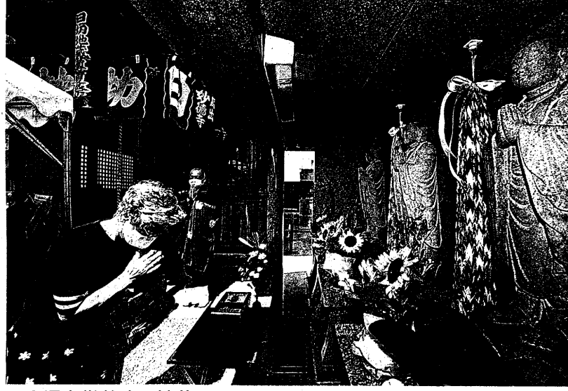
3児を供養する地蔵の前で手を合わせる地元住民 =24日午前10時半すぎ、福岡市東区の妙徳寺

福岡市東区の中道大橋で幼い3きょうだい犠牲になった飲酒運転事故から25日、14年を迎える。3