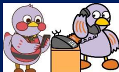
埼玉県マスコット さいたまっち&コパトン