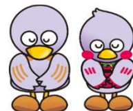
埼玉県マスコット さいたまっち&コパトン