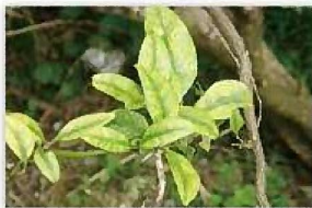
カンキツグリーニング病菌 (病気の症状)