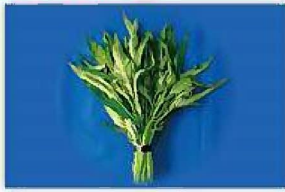
エンサイ (空心菜・ウンチェーバー) の生莖葉