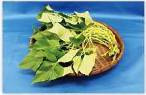
サツマイモ(紅イモなど) の生莖葉