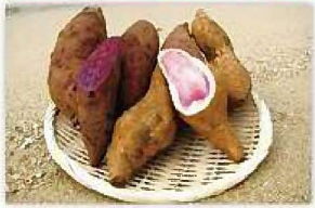
サツマイモ(紅イモなど) の生塊根