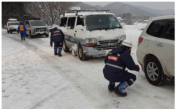
タイヤチェックの状況 (令和4年1月1日 国道17号みなかみ町)