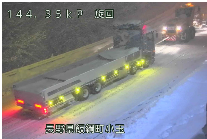
スタック車両の牽引状況 (令和3年12月17日 国道18号飯綱町)