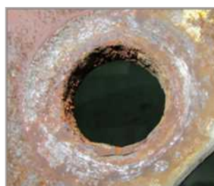
ホイールのボルト穴の損傷