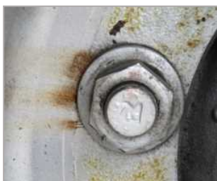
さび汁が流出した痕跡