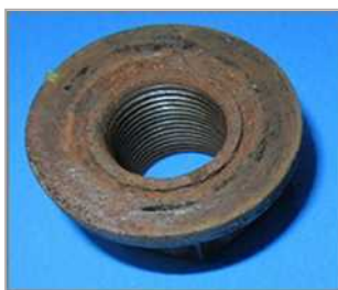
ワッシャ部が固着したナット