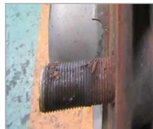
ボルトに著しいさびや汚れの付着