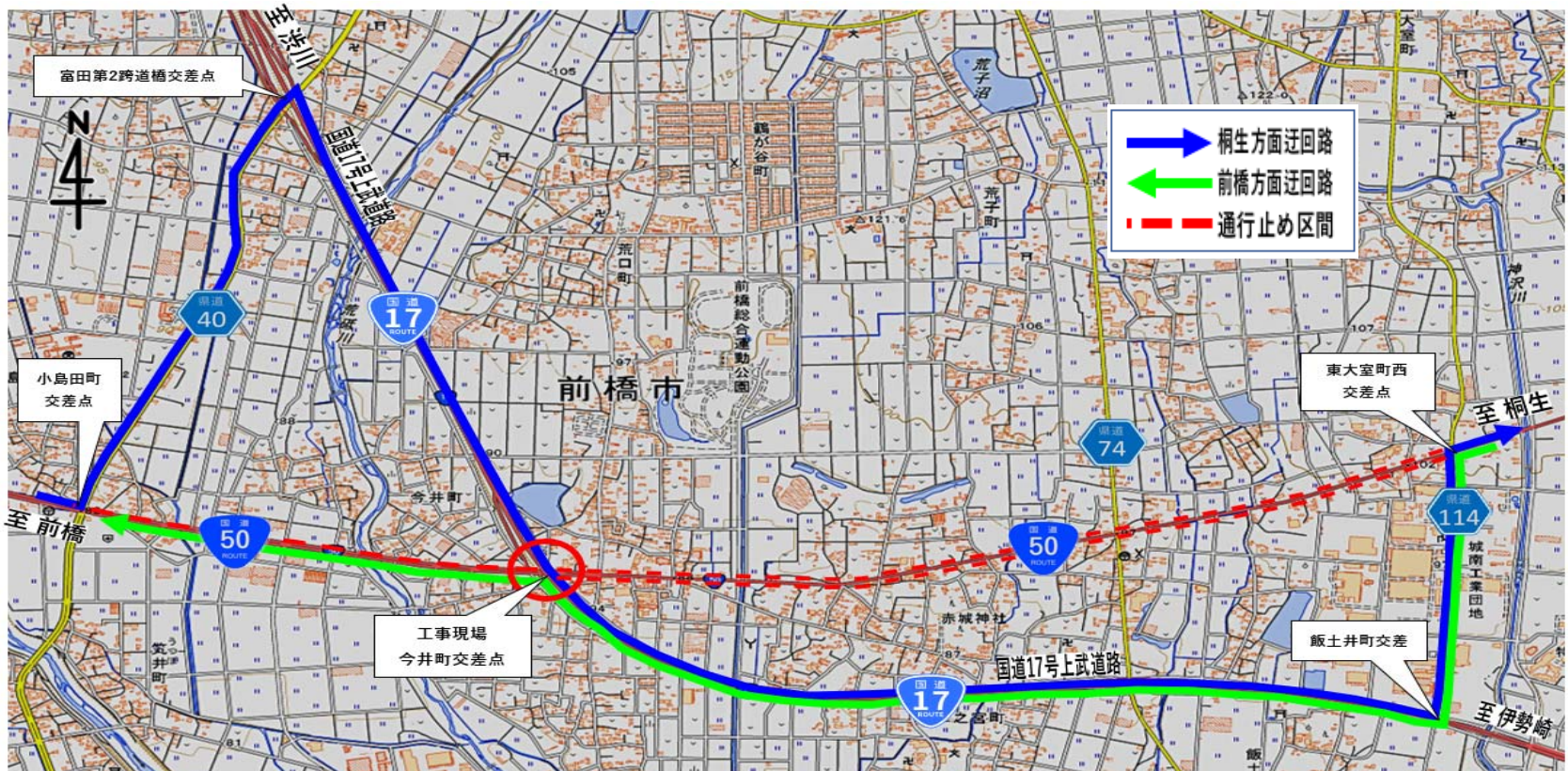
国土地理院ウェブサイト地図データをもとに東綱橋梁株式が作成しています