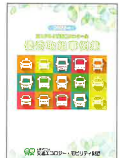
▲優秀取組事例集 (電子データのみで提供) (無料)