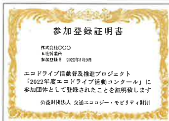
▲コンクール参加登録証明書 (電子データのみで提供)