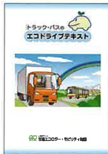
▲トラック・バスのエコドライブテキスト (200円/冊)