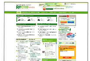
▲燃費管理支援サイトReCoo (無料/別途登録必要)