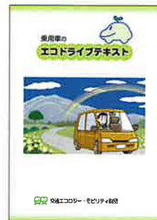
▲乗用車のエコドライブテキスト (200円/冊)