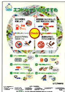
▲エコドライブ10のすすめポスター (無料)