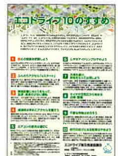
▲エコドライブ10のすすめチラシ・リーフレット (無料)