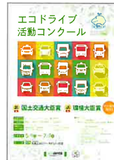
▲コンクールリーフレット (電子データのみで提供)