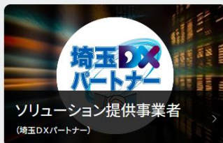
ソリューション提供事業者