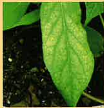
光化学オキシダントの影響で、白色斑点が入ったアサガオの葉